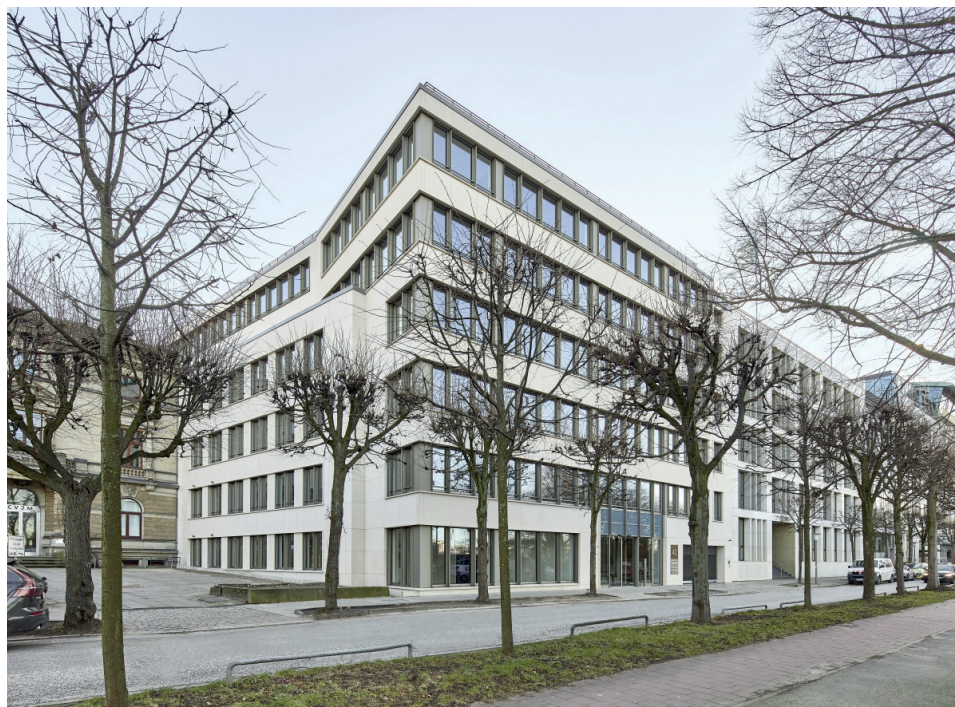
Anzeige Bild: Lloyd Fonds – Special Yield Opportunities

Neben der Lloyd Fonds-Zentrale an der Hamburger Außenalster gibt es Büros in Frankfurt am Main und München